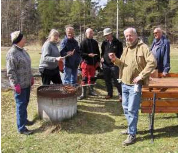
Lön för mödan, Städdagen okt.09